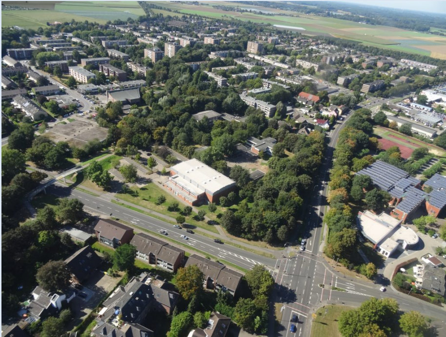
Hagelkreuz von oben